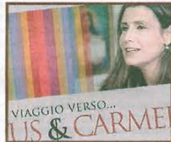
TESTIMONIANZA Claudia Koll protagonista di «In viaggio verso...»